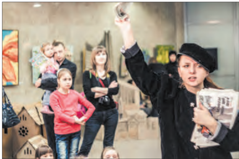
На фестывалі 2018 года.

нешта. Мы проста бяром і робім. І вось тады зусім не разумелі. Так што проста хадзілі па выстаўках плялек і казалі: «Слухайце, ёсць у нас такая ідэя... Можа, вы хочаце паўдзейнічаць?»