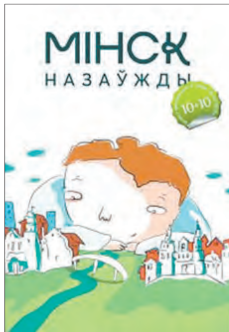
Вокладка кніжкі праекта «10+10».

Цяжка, канешне. Асабліва з прафесіянальнай экспертнай пляцоўкай, якую мы ўпарта — упарта-упарта — працягваем трымаць. Спачатку яе разлічвалі на бібліятэкараў, пасля кінулі, сталі арыентаваць на ўсіх зацікаўленых. Народ туды не зганяюць, запрашэнні хіба што рассылаем — і ўсё. Пляцоўка тая, насамрэч, найменш папулярная на