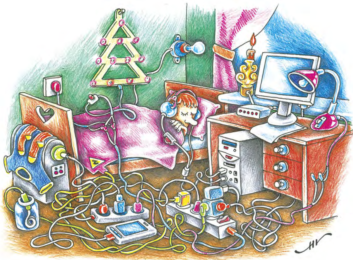
РИСУНОК АНАТОЛИЯ ЩЕГОЛЕВА

В декабре в сводки Минского городского управления МЧС попали два студенческих общежития. По предварительной информации, в одном из них пожар произошел из-за включенного в электросеть компьютера, в другом – из-за короткого замыкания проводки. К счастью, в обоих случаях обошлось без жертв, пострадали только комнаты, мебель и личные вещи. Но эти ситуации подняли на поверхность важный вопрос: умеют ли студенты и работники общежитий правильно действовать в условиях форс-мажора?