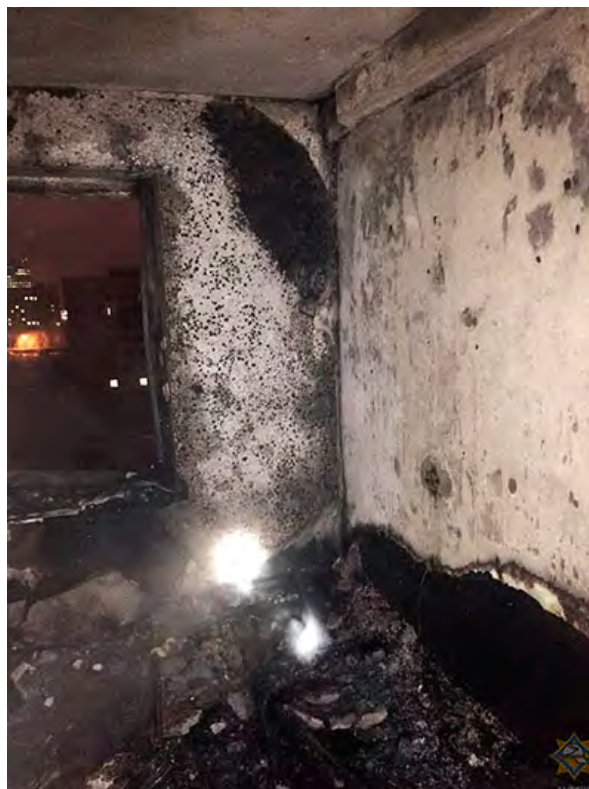
После пожара комнате понадобился ремонт